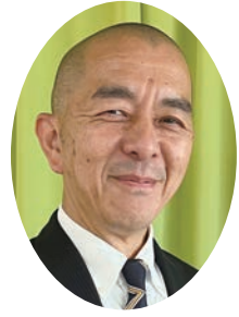
静岡県保育連合会会長