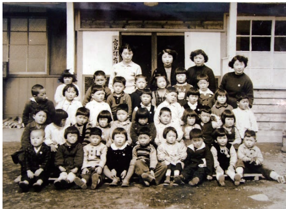
創立当時の木造園舎と保母と子どもたち (第1回卒園写真)

昭和二十八年当時富士宮市制十周年となり、旧富丘村地区の陳情団は幼稚園設立運動を展開しており、地域の人々の熱意に動かされ、保育所の設立を決議しました。後援会を組織し多くの寄付と借入金で元々富丘保育園として同年六月に園舎を起工し、九月竣工しました。