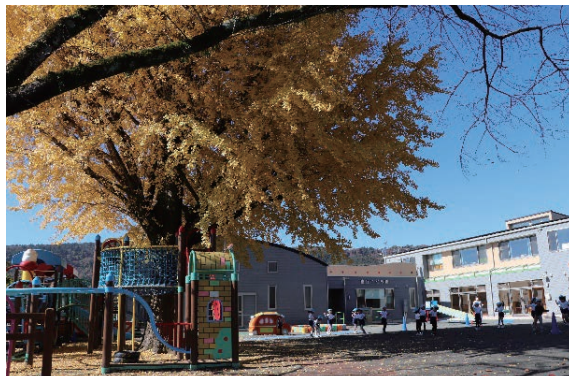
平成31年4月認定こども園認可 令和7年2月新園舎改築工事完了 (定員1号6名 2、3号118名)

その後、富丘保育園は平成三十一年四月に認定こども園へ移行し、今日に至っております。